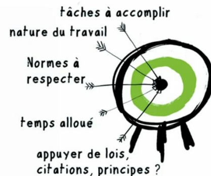
Figure 1 – Planifier sa recherche